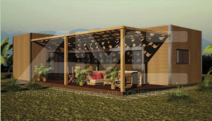
Fournisseur : A2C Construction

Emplacement 400 m 2 5 Cottages confort – 40 m 2 Terrasse 15 m 2 - couverte par une pergola